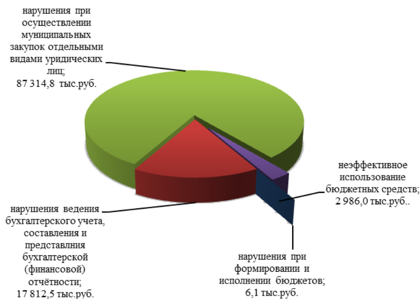
Диаграмма 3. Виды нарушений, выявленные в 2022 году в ходе контрольных мероприятий в суммовом выражении

По результатам проверок Контрольно-счётной палаты возмещено в бюджет и устранено финансовых нарушений на сумму 1 031,4 тыс.руб.