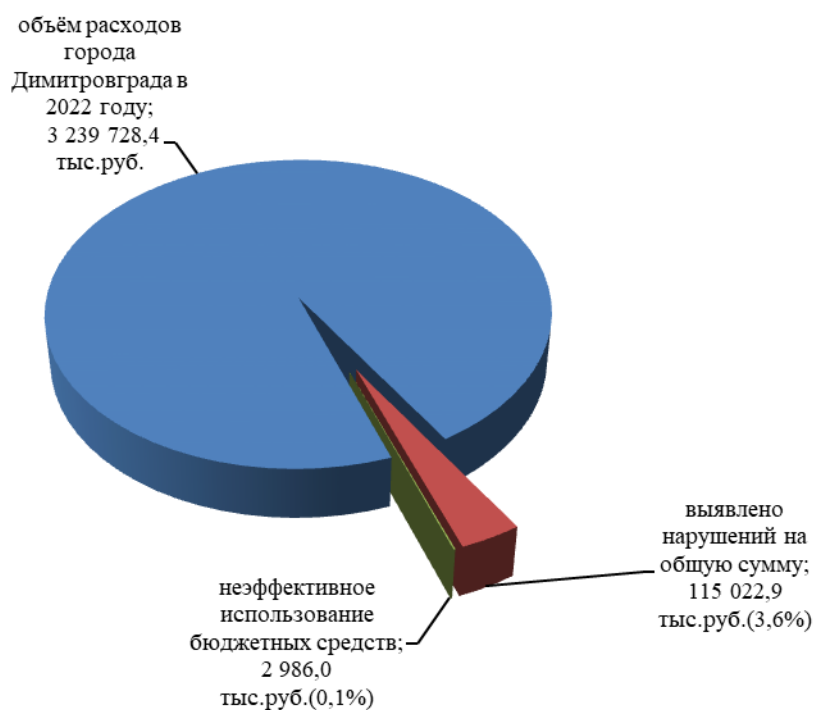
Диаграмма 2. Объем выявленных нарушений в общем объеме расходов города в 2022 году