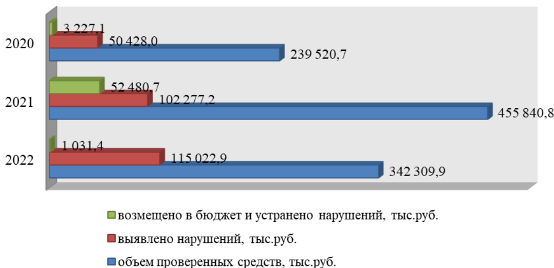
Диаграмма 4. Соотношение объема проверенных средств, выявленных и устранённых финансовых нарушений в ходе контрольных мероприятий, в 2020-2022 годах.

В ходе осуществлённых Контрольно-счётной палатой контрольных мероприятий в 2022 году было выявлено финансовых нарушений на общую сумму 115 022,9 тыс.руб., что составило 30,7% от объёма проверенных бюджетных средств; в 2021 году - 22,4%; в 2020 году – 21,1% (диаграмма 4).