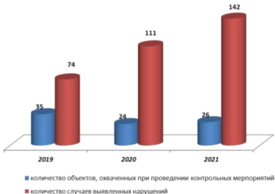
Диаграмма 5. Количество случаев выявленных финансовых нарушений и количество охваченных объектов в ходе контрольных мероприятий в 2019-2021 годах

По результатам контрольных мероприятий в 2021 году главным распорядителям бюджетных средств, а также руководителям муниципальных учреждений и иным участникам бюджетного процесса было направлено 55 представлений об устранении выявленных нарушений, возмещению причиненного ущерба (содержащих 178 требований), из которых: 52 представления исполнены в полном объёме, исполнение 3 представлений находится на контроле. По итогам исполнения вынесенных в 2021 году представлений возмещено в бюджет 2 387,7 тыс.руб. и устранено финансовых нарушений на сумму 271,8 тыс.руб.