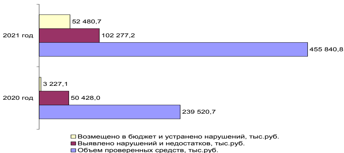
Диаграмма 4. Соотношение объема проверенных средств, выявленных и устранённых финансовых нарушений в ходе контрольных мероприятий, в 2020-2021 годах.

В ходе осуществлённых Контрольно-счётной палатой контрольных мероприятий в 2021 году было выявлено финансовых нарушений на общую сумму 102 277,2 тыс.руб., что составило 22,4% объёма проверенных бюджетных средств, в 2020 году – 21,1% (диаграммы 4, 5).