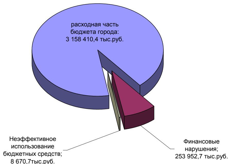
Диаграмма 2. Объем выявленных нарушений в общем объеме расходов города в 2021 году

Общий объем выявленных Контрольно-счётной палатой финансовых нарушений в 2021 году в объеме бюджета города Димитровграда по расходам составил – 8,0% , в 2020 - 2,8%; в 2019 - 7,8% (диаграмма 2 и диаграмма 3).