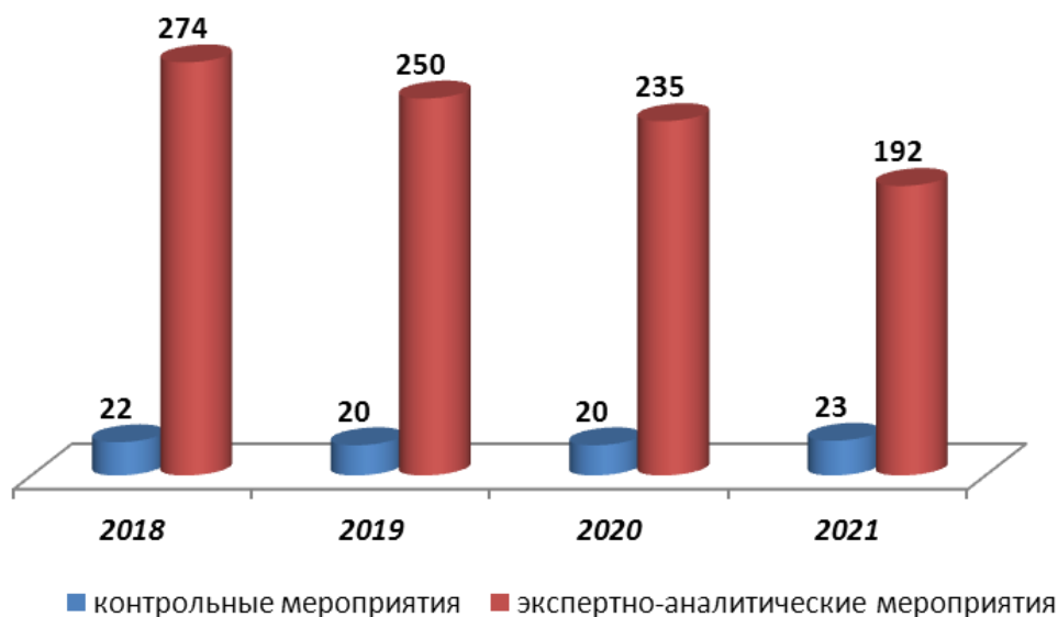
Диаграмма 1. Количество проведенных контрольных и экспертно-аналитических мероприятий за 2018 – 2021 годы

В 2021 году Контрольно-счётной палатой проведено 192 экспертно-аналитических мероприятий и 23 контрольных мероприятий (диаграмма 1).