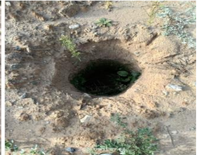
фотография 16 (осень 2024)