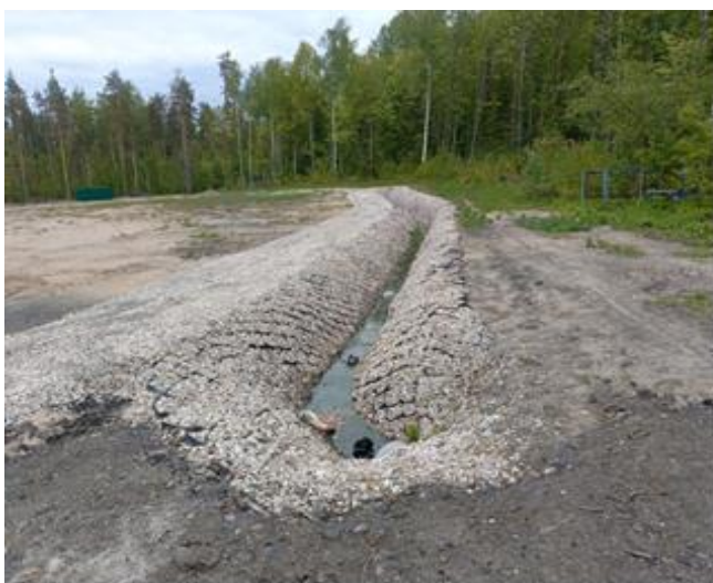
фотография 19 (весна 2024) грунтовые воды в дренажной канаве

контрольный колодец (камера отбора проб) - часть водосточной системы, колодец предназначен для отбора проб с целью отслеживания чистоты стоков (вода на дне – в пределах нормы)