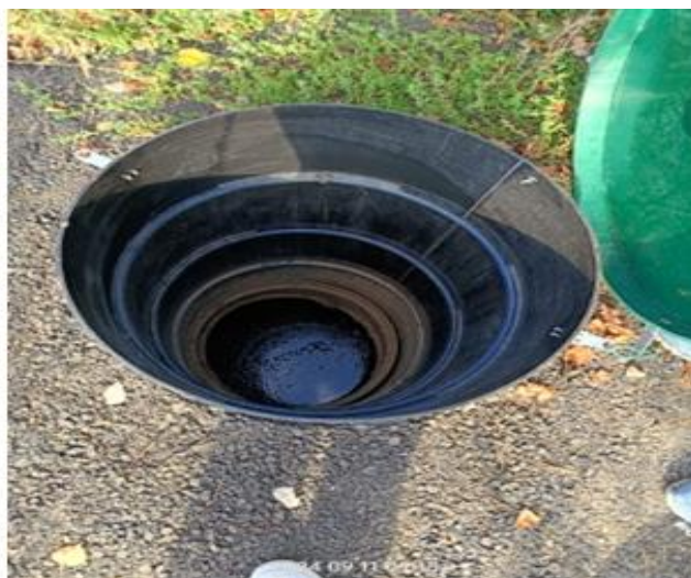
фотография 18 (осень 2024)

контрольный колодец (камера отбора проб) - часть водосточной системы, колодец предназначен для отбора проб с целью отслеживания чистоты стоков (вода на дне – в пределах нормы)