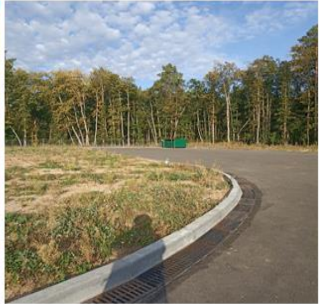
фотография 14 (осень 2024)

наличие и отсутствие грунтовых вод на территории Тиинского кладбища в зависимости от сезона