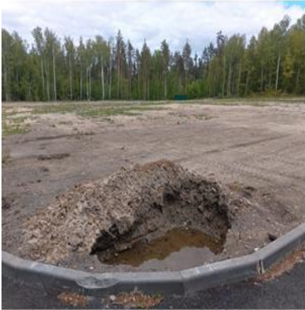
фотографии 13 (весна 2024)

территории в весенний период зафиксировано в сообщении депутата Ч.А.А. от 14.05.2024 № 73-ПОМСУ в адрес Генерального прокурора РФ и председателя Следственного комитета РФ (фотографии 13-20).