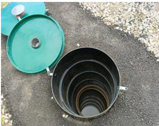
фотография 17 (весна 2024 года)