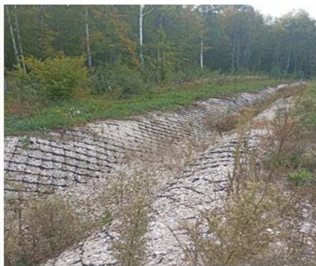
фотография 20 (осень 2024) дренажная канава сухая

Результаты инженерно-геологических изысканий отражённые в Техническом отчёте №78/2021-ИГИ нашли своё подтверждение в рамках временного периода (смены сезонов).