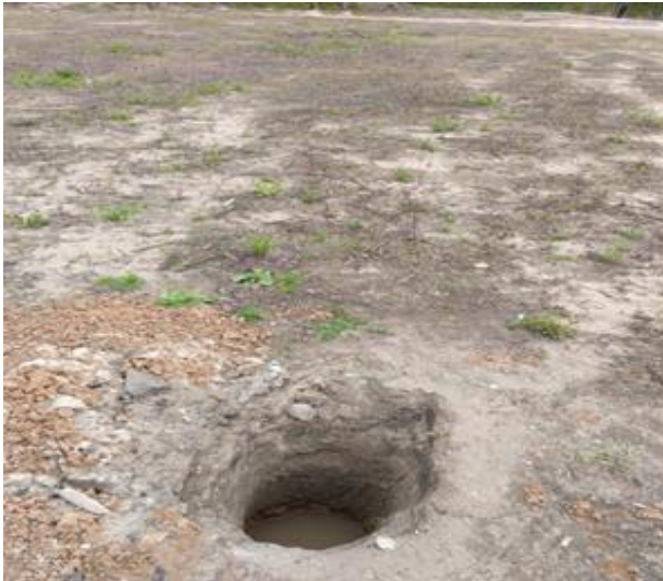
фотографии 15 (весна 2024)

наличие и отсутствие грунтовых вод на территории Тиинского кладбища в зависимости от сезона